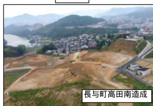
長与町高田南造成