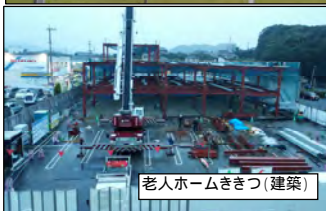
老人ホームききつ(建築)